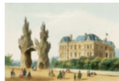
Les "aiguilles" signalant l'entrée monumentale de l'aquarium construit en 1866 dans les jardins du casino.

L'accès aux bains de mer froids se faisait depuis un pavillon annexe, où se distribuait le nécessaire pour les ablutions et, selon un principe inchangé, par l'une des 120 voitures dont disposait l'établissement en 1864.