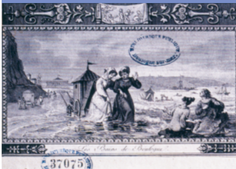
Les bains de Boulogne. Gravure. Bibl. mun. Cliché Animation du patrimoine

Laissez-vous conter Boulogne-sur-Mer, ville d'art et d'histoire... ...en compagnie d'un guide-conférencier agréé par le ministère de la Culture et de la Communication. Le guide vous accueille. Il connaît toutes les facettes de Boulogne-sur-Mer et vous donne les clefs de lecture pour comprendre l'échelle d'une place, le développement de la ville au fil de ses quartiers. Le guide est à votre écoute. N'hésitez pas à lui poser vos questions.