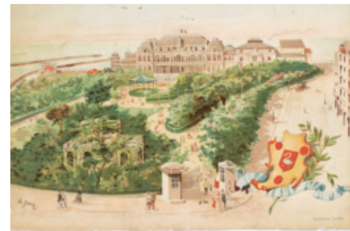
Le casino au début du 20 e siècle, vu au terme de son évolution avec ses constructions annexes.