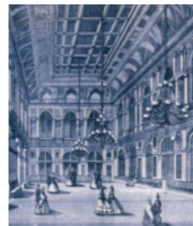
La grande salle du casino en 1863.

Dans les sous-sols est disposé un service d'hydrothérapie tandis que sur les terrasses extérieures est aménagée une piscine découverte, l'une des premières du genre en France. Lieu d'apprentissage de la natation, elle témoigne de l'évolution de la baignade vers une pratique hédoniste et/ou sportive.