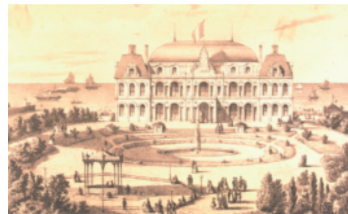
Le second établissement de bains de mer froids. Vue générale côté jardin peu après 1863.

Ce succès influe sur l'architecture de l'édifice qui fait l'objet d'agrandissements successifs. Malgré cette prospérité, l'établissement allait être confronté à sa propre insuffisance et se heurter à une concurrence menaçante générée par l'émergence de stations balnéaires fondées ex nihilo en Normandie, en Bretagne et sur les côtes atlantique et méditerranéenne, rendues plus accessibles grâce au développement du chemin de fer.