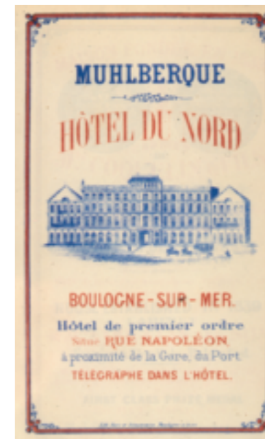
L'hôtel du Nord, qui était situé actuelle rue Victor Hugo, vu dans une publicité de 1864.

Deux implantations sont privilégiées : le centre ville, siège des établissements les plus anciens ; le quai Gambetta face au port, ainsi bordé d'un front presque ininterrompu d'hôtels. En marge des deux secteurs, quelques établissements s'installent près de la gare ouverte en 1848 à Capécure et d'autres au plus près de la mer.