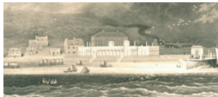
Le premier établissement de bains de mer froids vu peu après sa construction en 1825.

Doyenne des stations balnéaires avec Dieppe, Boulogne-sur-Mer reste tout au long du 19 e siècle parmi les destinations les plus en vogue grâce à une infrastructure touristique sans cesse améliorée.