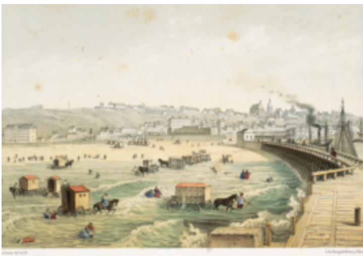
La prise des bains au moyen des "voitures-baignoires", conçues par Marguet en 1824. Lithographie d'Asselineau.

Le type de pratique, opposée à la prise des bains en pleine mer à l'anglaise, en open sea , joint à un contexte défavorable (Révolution, affrontement franco-britannique) firent que l'établissement ne connut jamais la prospérité escomptée.