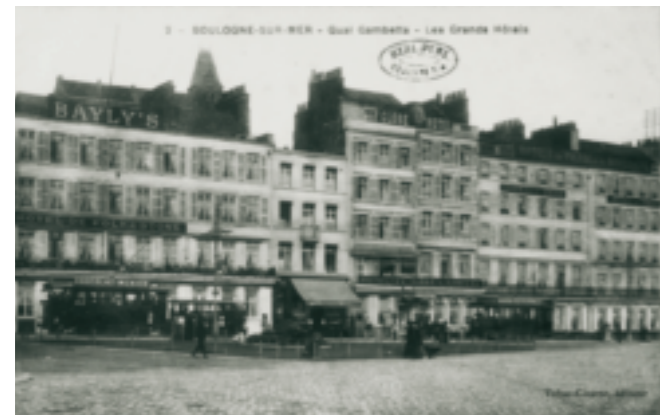
Les hôtels de voyageurs le long du quai Gambetta au début du 20 e siècle. Carte postale.

L'hôtel du Pavillon Impérial érigé en 1854 boulevard Sainte-Beuve traduit une nouveauté majeure par son implantation face à la mer, annonçant ainsi les grands palaces de la fin du siècle. L'ex hôtel Princess, construit en 1907 en face des jardins du Casino (4, boulevard Sainte-Beuve), constitue aujourd'hui, en dépit de son réaménagement en immeuble d'habitation, le seul témoin de la station balnéaire boulonnaise du 19 e siècle, le reste ayant disparu pendant la Seconde Guerre.