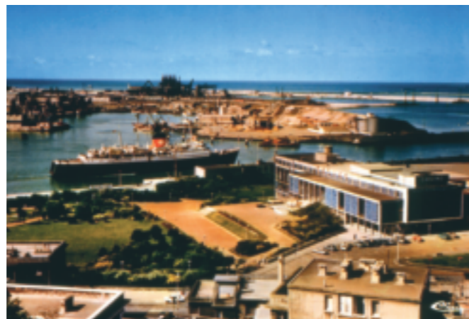
Le casino de l'après-guerre, inauguré en 1960.