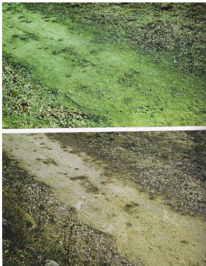
Photographies en infrarouge et lumière visible des traces au sol (Henri Julien, 13 janvier 1981)

Le passé du site n'est pas soigneusement étudié par le GEPAN, ce qui constitue pour ce cas une grave lacune. Contrairement à ce que celui-ci peut laisser entendre (« cette partie de la propriété n'est généralement pas fréquentée »), des traces de passages de véhicules sont clairement visibles depuis l'entrée du chemin jusqu'à l'intérieur de « la » trace et sur la zone herbeuse attenante 14 . En réalité, une dépendance a été bâtie, à une vingtaine de mètres de là, au cours du mois précédant l'observation. Cette information d'importance a été recueillie auprès du témoin par l'ufologue amateur Michel Figuet, les enquêteurs du GEPAN n'y faisant pour leur part aucune allusion. De tels travaux de maçonnerie supposent le transport, par un ou plusieurs véhicules automobiles, le dépôt de matériaux de construction, puis la préparation et l'utilisation de ciment sur le site.