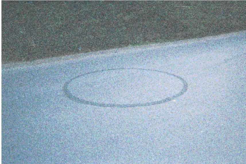
Exemple de trace de ripage de pneu en couronne laissée par une moto

Des années après, le SEPRA, à partir de l’empreinte mécanique (grossièrement) mesurée par la gendarmerie et le GEPAN, tentera d’évaluer la masse de l’objet censé avoir atterri sur la propriété de M. Nicolai. En tenant compte de la dureté des sols, les effets générés par l’OVNI auraient été comparés à ceux d’un hélicoptère et du LEM lunaire atterrissant au même endroit. M. Velasco affirme être parvenu à la conclusion que l’engin avait une masse comprise entre 250 et 1000 kilogrammes, puis, plus précisément, entre 500 et 700 kilogrammes (le poids d’une automobile, par exemple...) 35 . Rappelons que, précédemment, le même M. Velasco avait soutenu que les tests effectués permettaient « de dire avec une relative certitude que l’objet décrit par Renato Nicolai pouvait peser entre 4 et 5 tonnes » 36 . Toujours selon lui, l’objet était indubitablement métallique, du fait des traces de zinc retrouvées. En réalité, seules des stries avec dépôt métallique ferreux ont été découvertes. Le zinc a été identifié uniquement dans la substance noire, non métallique. Où est ici la rigueur scientifique si souvent vantée ?