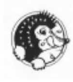
Figure n° 21 : logo Hedgehog Foods

Dans le même esprit de détente et de naturel, il a pu être utilisé pour présenter des manifestations, ce qui fut le cas pour le salon des loisirs créatifs et du faire soi-même (patchwork, quilts anciens, broderie, cerfs-volants, atelier textile etc...) qui a eu lieu en avril 1998 au parc floral de Paris (figure n° 22).