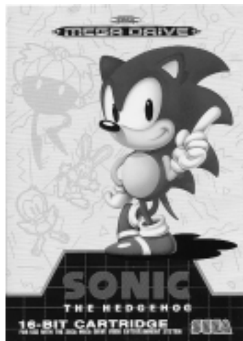
Figure n° 17 : Sonic le Hérisson

Le Hérisson correspondait bien aux pré-requis ; de plus les programmeurs ont particulièrement soigné les mimiques et les attitudes, créé de magnifiques décors de façon à obtenir une qualité et un environnement sans violence qui rappellent les films de Walt Disney. C'est ainsi que le petit Insectivore a envahi les consoles (HALLIER, 1995) (figure n° 17).