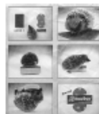
Figure n° 27 : publicité éponge