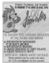
Figure n° 22 : logo commercial d'une exposition

Dans le même esprit de détente et de naturel, il a pu être utilisé pour présenter des manifestations, ce qui fut le cas pour le salon des loisirs créatifs et du faire soi-même (patchwork, quilts anciens, broderie, cerfs-volants, atelier textile etc...) qui a eu lieu en avril 1998 au parc floral de Paris (figure n° 22).