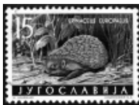
Figure n° 15 : timbre européen