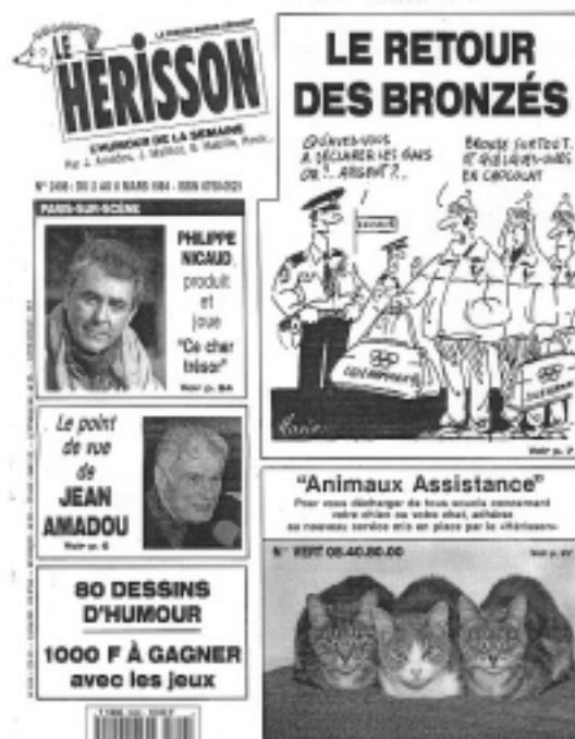
Figure n° 14 : journal «Le Hérisson»

Il exploite ici le côté agréable, sympathique et néanmoins piquant du petit animal (figure n° 14).