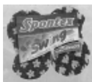
Figure n° 26 : publicité éponge