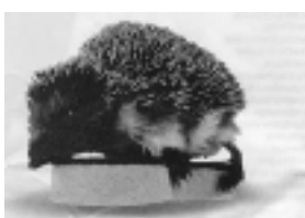
Figure n° 25 : publicité éponge

Le spot télévisé montre un hérisson qui s'approche de deux éponges grattantes : marque x et marque présentée, et choisit de monter, se rouler ou danser avec l'éponge Swing, comme ci celle-ci ressemblait à un partenaire de notre animal. On cherche ici à évoquer la qualité de la surface grattante du produit, aussi efficace pour récurer que le seraient les piquants du hérisson (figures n° 25 à 27).