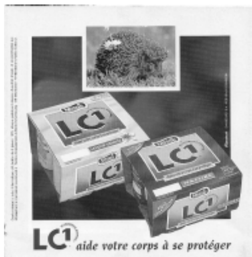
Figure n° 24 : publicité yaourt

Sur un dépliant publicitaire, une photographie de l'animal est présentée dans un petit cadre surmontant la représentation de deux paquets de ces yaourts. On y voit un hérisson en alerte, avec les piquants de la tête érigés. Une fleur de marguerite pend contre le flanc droit de l'animal, qui est placée dans l'herbe, mettant ainsi en scène la «Nature», et évoquant avec la fleur une touche de douceur (figure n° 24).