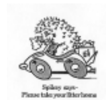
Figure n° 19 : logo Keep Britain Tidy